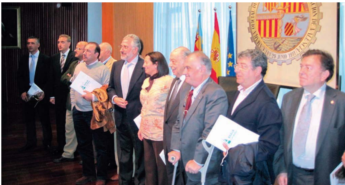
AUTORIDADES Y DIRECTIVOS.